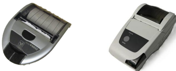
Kuva 4. epocin tulostimet