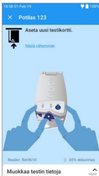
Kuva 4. Testikortin asettaminen Readeriin