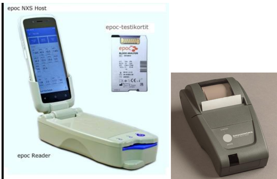
Kuva 1. epoc -laitteen osat

Laitteen valmistaja on Epocal Inc. ja jakelija Timik.